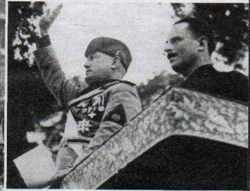
S Mussolinim: Taliansky diktátor bol pre Mosleyho vzorom.