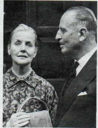
Neúspešný politik: Sir Oswald Mosley s manželkou Dianou v roku 1962. Jeho oponenti ho považovali za podomového propagátora odpornej ideológie a darebáka.