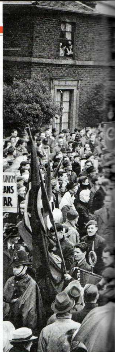
Dobry rečník: Mosley si vedel získať publikum, podobne ako Hitler.

ne by sa bol stal premiérom Veľkej Británie. Už čoskoro sa však u neho objavil radikalizmus a absolútna neschopnosť fungovať v existujúcich politických štruktúrach. Postavil sa do opozície proti politike strany a prešiel k opozičným labouristom. Ani tam však našiel pochopenie pre svoje veľké plány, a tak založil vlastnú, Novú stranu - New Party. Mosley očakával volebný úspech a triumfálny návrat do najvyššej politiky. Opak