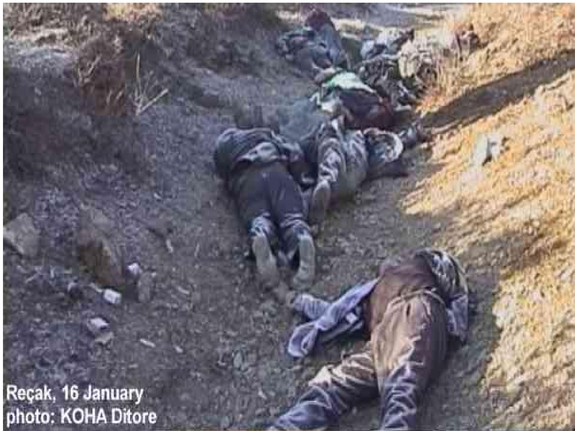
Reçak, 16 January