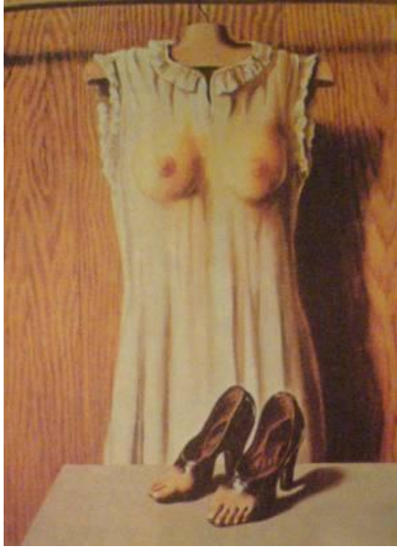
René Magritte (rené magri, 1898-1967): Červený model (olej, 1935). Surrealistický zmysel pre humor a komickosť.