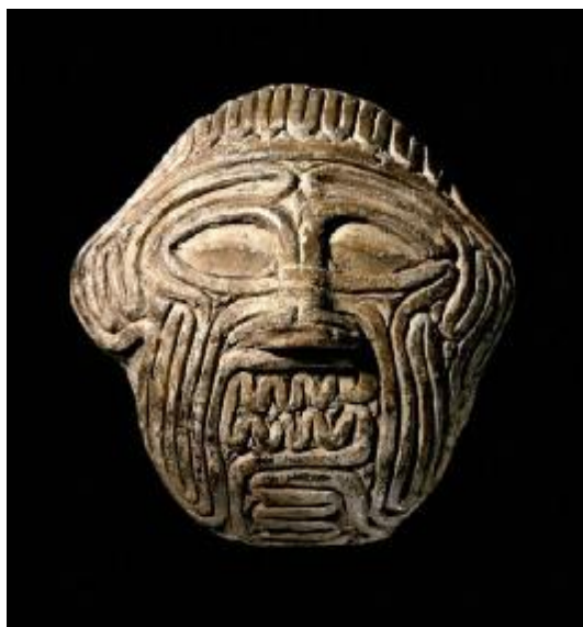
Vládca cédrového lesa Chuvava